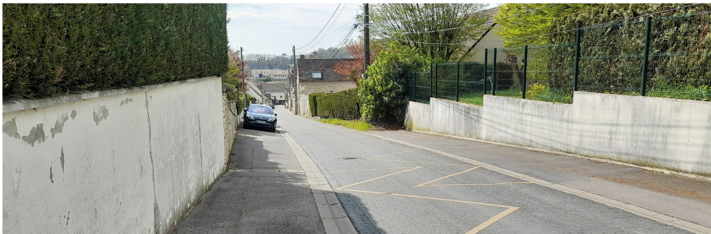
Rue de Béthencourt