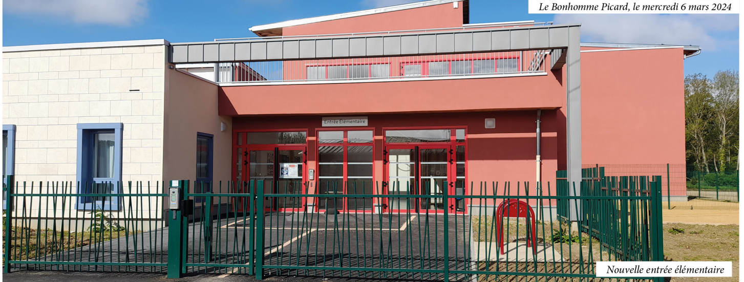
Nouvelle entrée élémentaire

Le Bonhomme Picard, le mercredi 6 mars 2024