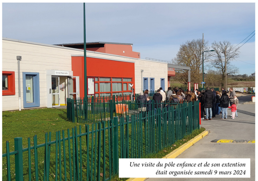
Une visite du pôle enfance et de son extension était organisée samedi 9 mars 2024

>> Dans un monde où de nombreuses personnes rêvent de posséder les équipements dernier cri, les élus, quant à eux, rêvent depuis 15 ans d'offrir à tous les enfants de Breuil-le-Vert une école neuve, moderne répondant aux normes actuelles. Nous voyons enfin l'aboutissement d'un projet ambitieux qui a nécessité 7 millions d'euros d'argent public sans jamais avoir augmenté les taux d'imposition locaux. Une visite du Pôle Enfance Olympe de Gouges a eu lieu samedi 9 mars qui a permis aux parents et aux enfants de découvrir leur futur univers. Le 11 mars en présence de M me l'Inspectrice de l'Éducation Nationale et de quelques élus, la rentrée s'est très bien passée.