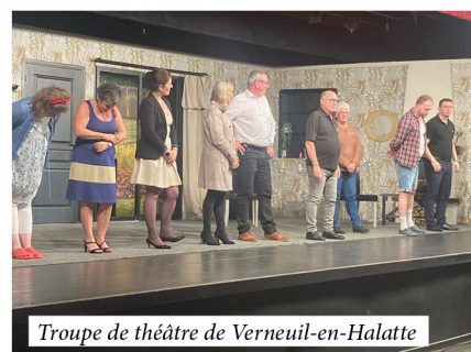
Troupe de théâtre de Verneuil-en-Halatte