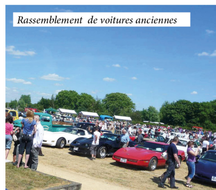
Rassemblement de voitures anciennes