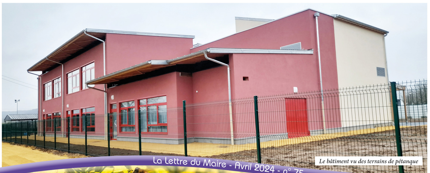
Le bâtiment vu des terrains de pétanque