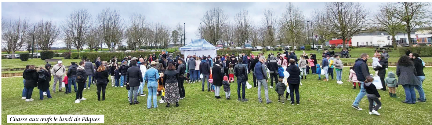
Chasse aux œufs le lundi de Pâques

» La commune de Breuil-le-Vert dispose depuis plus de 20 ans d'un espace vert, d'une surface de 6600 m 2 , appelé "Théâtre de verdure" situé à l'entrée du parc du Grand-Air. Ce théâtre de verdure n'a pas trouvé de véritables utilisations hormis quelques manifestations d'envergure (présentations de vieilles voitures, jeux intervillages). Actuellement les événements planifiés en extérieur au parc du Grand-Air sont très dépendants des aléas du climat sans solution de repli. La météo constitue donc un facteur imprévisible de la réussite d'un événement planifié des semaines en amont. Les organisateurs doivent s'adapter à la pluie, au soleil, à la chaleur, au vent ou au sol qui peut être sec, détrempé, boueux, glissant, etc. Ces inconvénients freinent la volonté des associations.