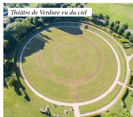
Théâtre de Verdure vu du ciel

» Nous avons donc réfléchi et après avoir recueilli plusieurs propositions, l'idée du projet consiste à valoriser l'espace circulaire de 90 mètres de diamètre en construisant un nouvel équipement structurant. Ce nouvel équipement devra permettre de renforcer, améliorer et dynamiser les activités déjà offertes au parc municipal. Signe des temps, il n'est pas question de créer une nouvelle salle fermée qu'il faudra refroidir en été et chauffer en hiver. Il s'agit de construire une halle couverte mais ouverte qui offrira aux différents utilisateurs un endroit permettant, avec certitude, d'organiser diverses activités sans se préoccuper des conditions météorologiques. Bien sûr, cette halle ne couvrira qu'une partie du théâtre de verdure ! Elle présentera une grande polyvalence d'exploitation et ne sera pas réservée à l'usage exclusif d'une seule association. Cette réalisation devra servir l'intérêt général. Il est proposé d'intégrer dans le programme un local de stockage (tables, chaises, bancs, divers), de prévoir également une scène, un sol permettant de multiples utilisations, des WC publics et un cheminement en "stabilisé" facilitant l'accès et le stationnement de quelques véhicules des organisateurs.