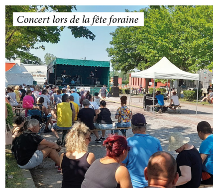
Concert lors de la fête foraine